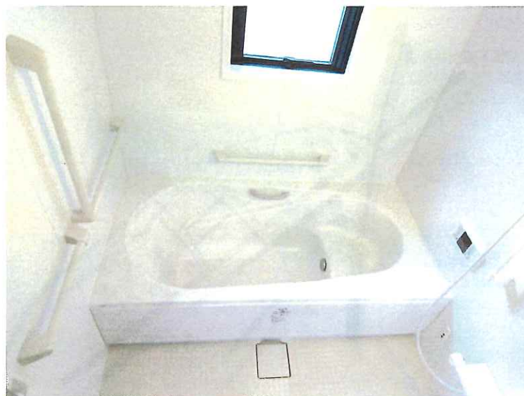
入浴介護加算Ⅱ 55 単位 / 回